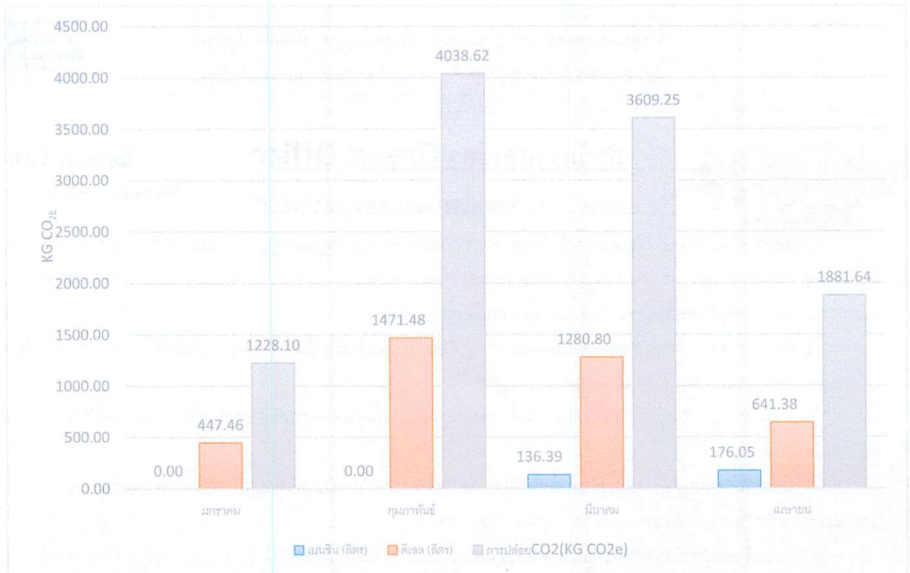
ภาพ 1 ปริมาณก๊าซเรือนกระจกทางตรงจากการใช้ทรัพยากรและพลังงาน อาคารสำนักงานอธิการบดี เดือนมกราคม - เมษายน 2561